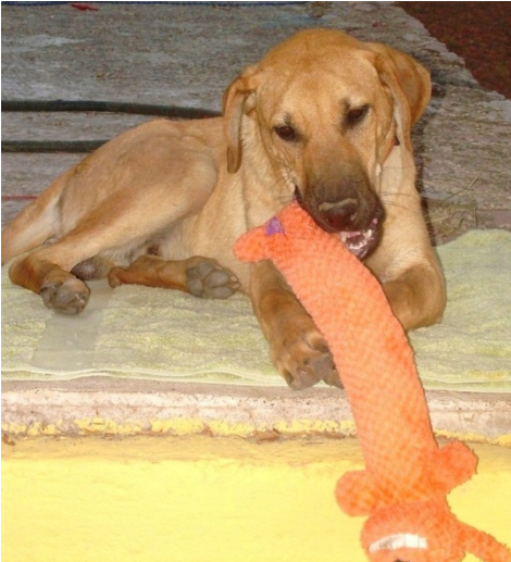
Casey con su primer juguete

recuperación. Se veía así en su primer día en mi casa con su primer juguete.