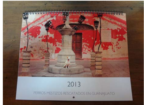
Edición española del calendario

muy buenos regalos navideños. Cuestan 250 pesos, o $25 USD comprados por PayPal para mandar a los EEUU. Hazte clic aquí para comprarlos de Amigos por PayPal.