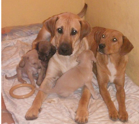
Casey, Canela y sus puppies

se ven como una hermosa familia? Por supuesto seguimos persiguiendo a Vainilla con la esperanza de esterilizarla también.