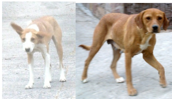
Vainilla (izquierda) y Canela (derecha)

Todo empezó con un grupo de perros—cuatro machos y dos hembras jóvenes—que vivían en unas madrigueras de la colina arriba de la Calle Durán. Después de entrar en celo por la primera vez a la edad de seis meses, las hembras se embarazaron y dieron a luz. Mientras que observaba a las dos mamás, Canela y Vainilla, con sus cachorros buscando comida en la basura, no pude evitar sentir lástima por ellos y así comencé a alimentarlos. Quería capturarlos y esterilizar a las mamás antes de que se embarazaran de nuevo.